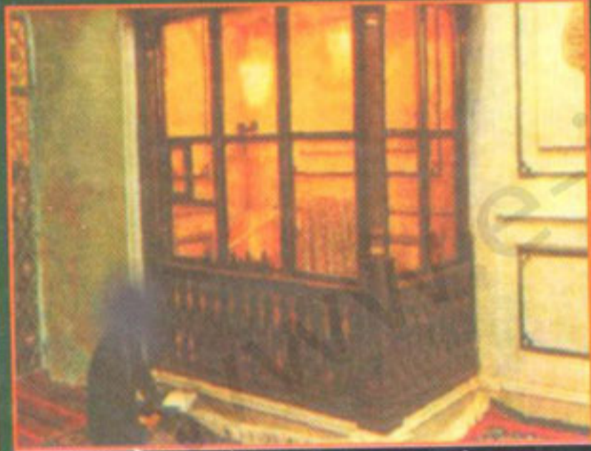
حضرت حسینؑ کا سر مبارک دمشق میں دفن ہے