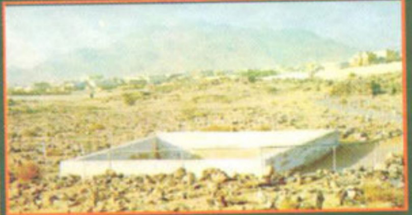
اس چار دیواری میں سید الشہداء حضرت حمزہ رضی اللہ عنہ کا جائے مدفون ہے

چوک فوارہ ملتان ان پکٹمان فون: 4540513-4519240