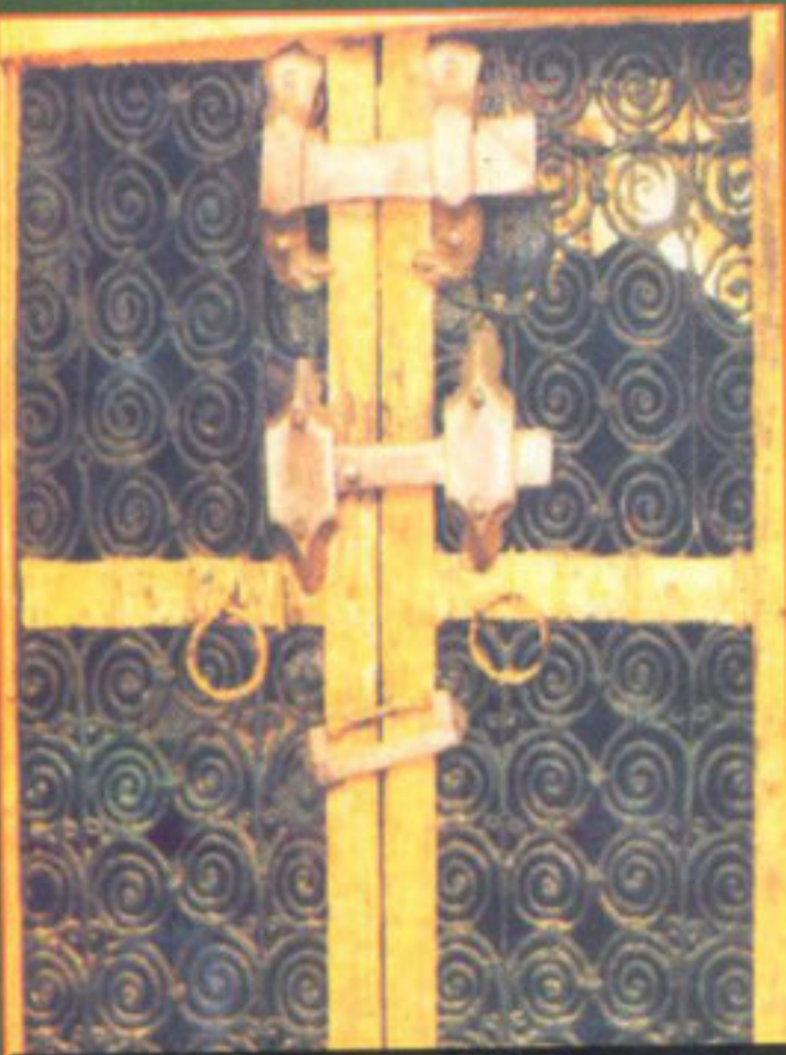
والدہ ماجدہ حضرت حسینؑ سیدہ فاطمہ رضی اللہ عنہا کے گھر کا دروازہ