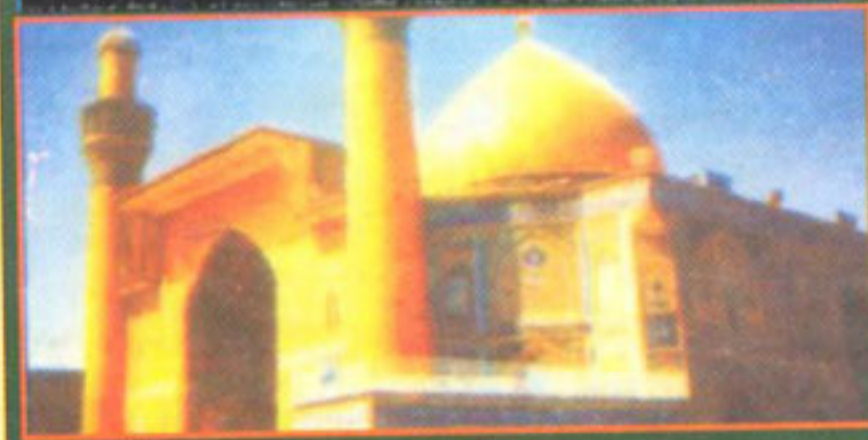
نجف اشرف (عراق) میں امیر المؤمنین حضرت علی رضی اللہ عنہ کا روضہ مبارک