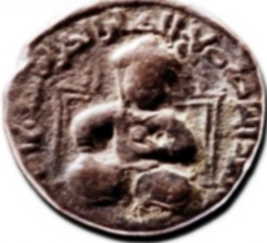
نقش صلاح الدین ایوبی بر یک سکه مسی