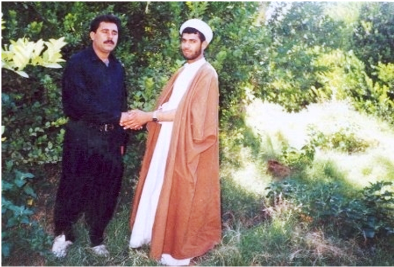
حجت الإسلام مرتضی رادمهر در لباس حوزوی همراه با یکی دیگر